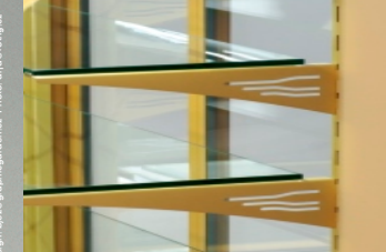
Detail uchycení polic / Detail of shelves holder

2012 © Design: bea@graphlogarden.cz