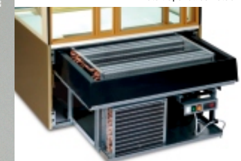
Snadná demontáž chladicí jednotky / Easy access to cooling unit